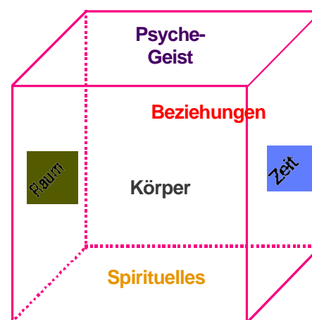
Abb.1: Anthropologisches Würfelmodell IKP nach Dr. med. Y. Maurer (1987, 1993, 1999)

Bei dieser Bewältigung helfen uns auch die Ressourcen, die sich aus dem ganzheitlichen Anthropologischen Würfelmodell IKP ableiten :